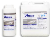
テックス7（アクリル樹脂系吸水防止材） 1kg・5kg/ポリ容器入り 18kg/缶