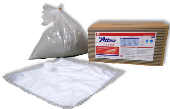
エース T-100 21セットkg/段ボール箱入り（粉体20kg+強化剤1kg）